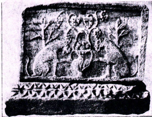
Von der einst mit Farbe aufgetragen gewesenen Inschrift fehlt jede Spur.